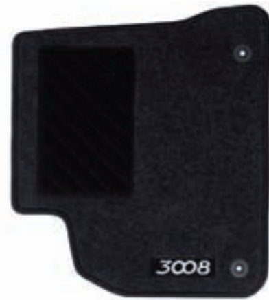
Jeu de tapis moquette avant et arrière en forme 3D

Les tapis protègent durablement la moquette d'origine. Ils sont disponibles en différents textiles et matières pour vous offrir le plus grand choix. De plus, pour un positionnement précis, le tapis conducteur se clippe sur les fixations existantes.