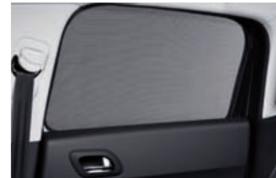
Stores pare-soleil latéraux Encastrables, ils favorisent la protection des passagers contre les rayons du soleil en occultant les vitres des portes arrière.