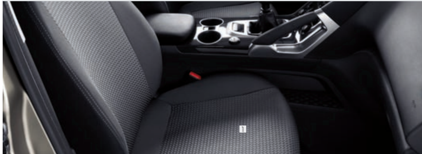
1 Housses de siège Brasilia

Votre 3008 est un espace de vie. Rendez-le encore plus pratique, confortable et sûr avec ces accessoires spécialement pensés pour faire de vos déplacements d'agréables moments.