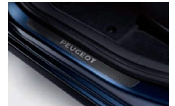
Protecteurs de seuil de porte En PVC aspect carbone ou en inox, les protecteurs de seuil de porte de 3008 allient esthétique et protection des bas de caisse.