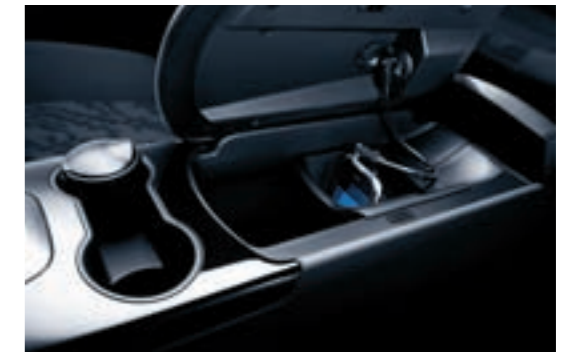
Rangement vide-poche Très pratique, il vous apporte encore plus de possibilités de rangement.