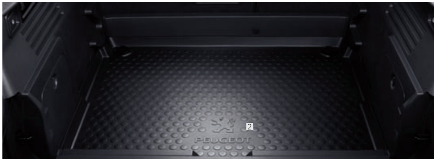
2 Bac de coffre Étanche, antidérapant, très résistant, il protège le coffre de votre 3008. Monté sans fixation et facile à entretenir.