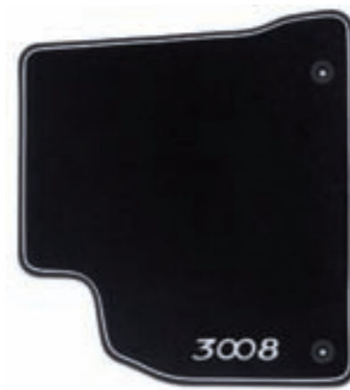
Jeu de tapis moquette aiguilletée