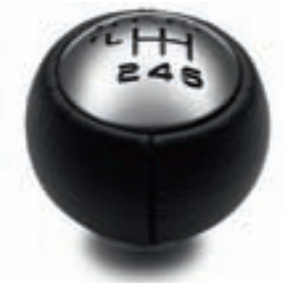
Pommeau "boule tronquée" en alliage aluminium Boîte manuelle 5 vitesses Boîte manuelle 6 vitesses