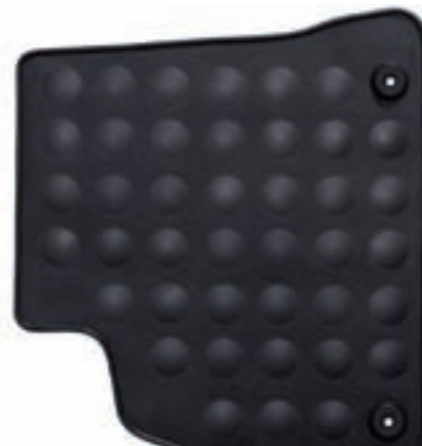
Jeu de tapis en Caoutchouc avant et arrière